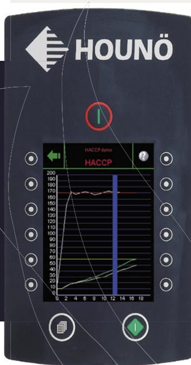
Diagramme de la fonction HACCP

Utilisez, par exemple, la fonction de contrôle HACCP pour documenter la température au cœur lorsque vous préparez des produits sensibles à la température tels que de la volaille.